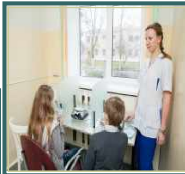
Имеется мини- бассейн.

Один из основных факторов оздоровления обучающихся и формирования у них культуры питания — организация качественного пятиразового питания с использованием современных методик детской диетологии. На пищеблоке работают высококвалифицированные специалисты, используется современное оборудование